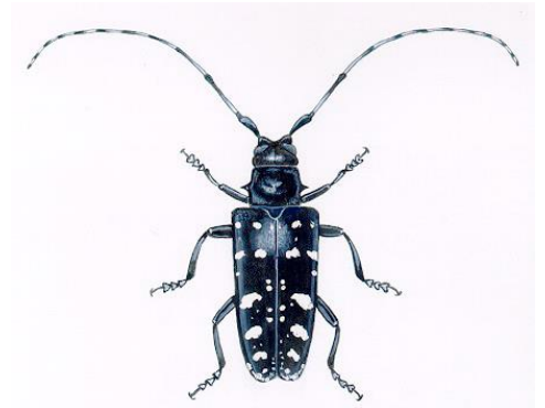
Taille réelle approximative

Découpez chaque antenne en laissant une marge d'environ 1,2 cm autour du dessin pour que le papier soit plus résistant. Si vous en avez, collez au dos des bâtonnets de sucettes glacées pour empêcher que l'antenne se retourne. Agrafez l'antenne sur le masque comme indiqué en plaçant le rectangle noir de l'antenne derrière le masque avant l'agrafage.